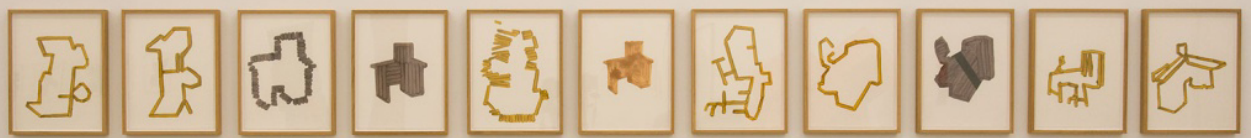
Siluetak. Pintura metálica. 32 x 24 cm