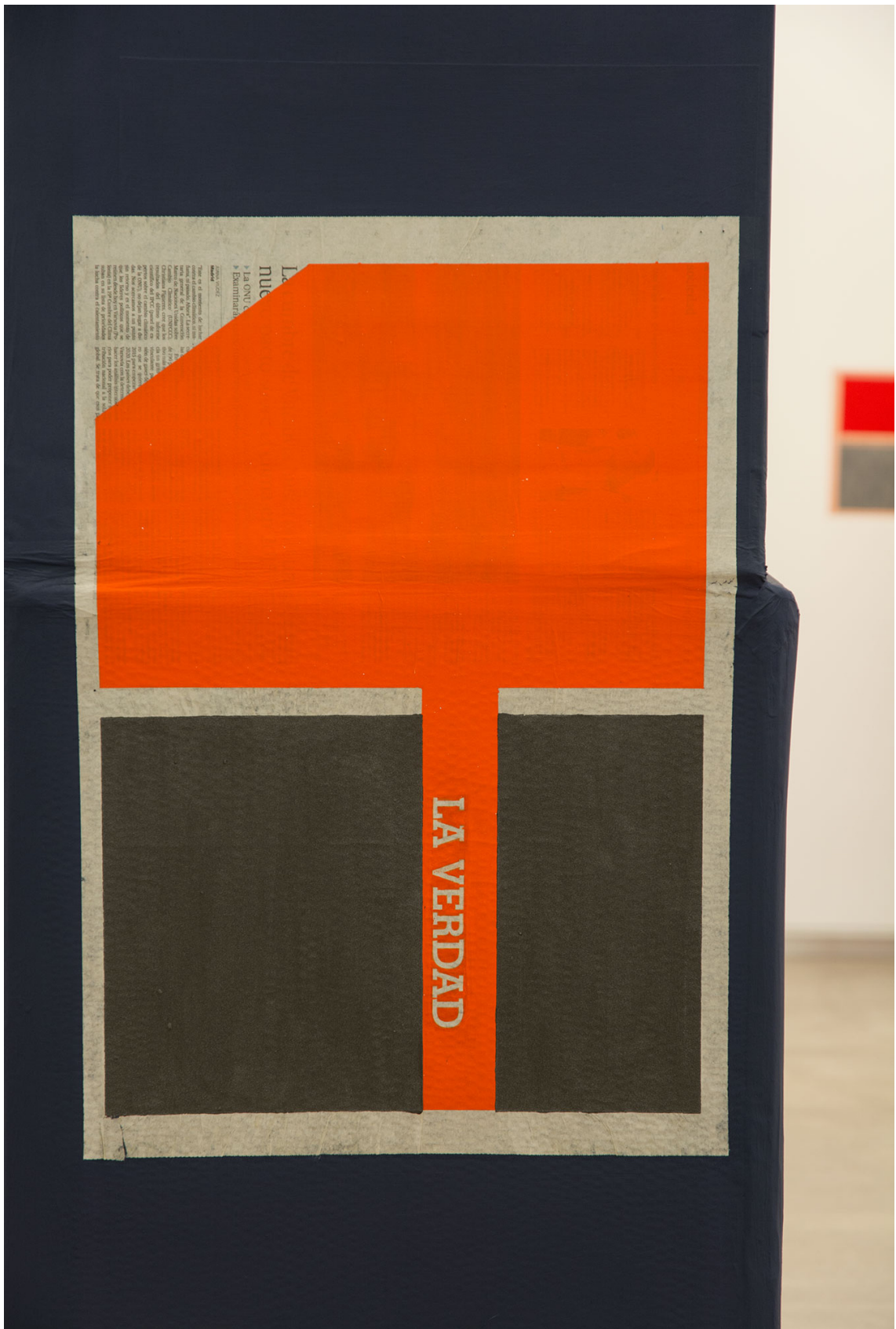
Detalle de la instalación