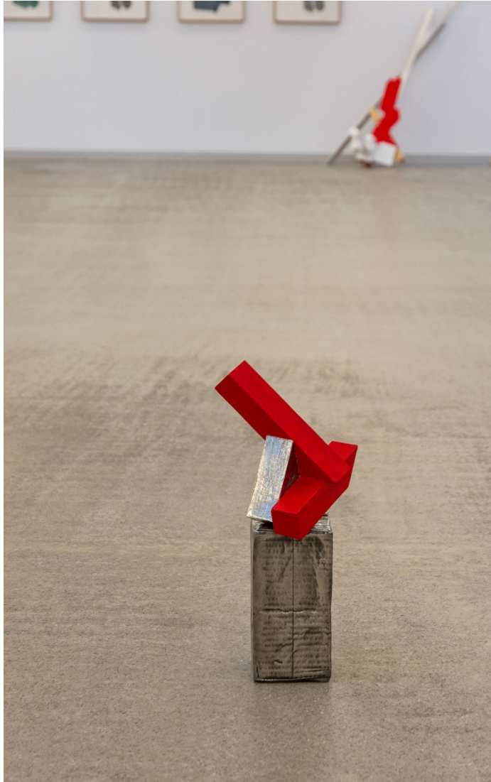
La verdad. Acero inoxidable y pintura. 85 x 90 x 34 cm