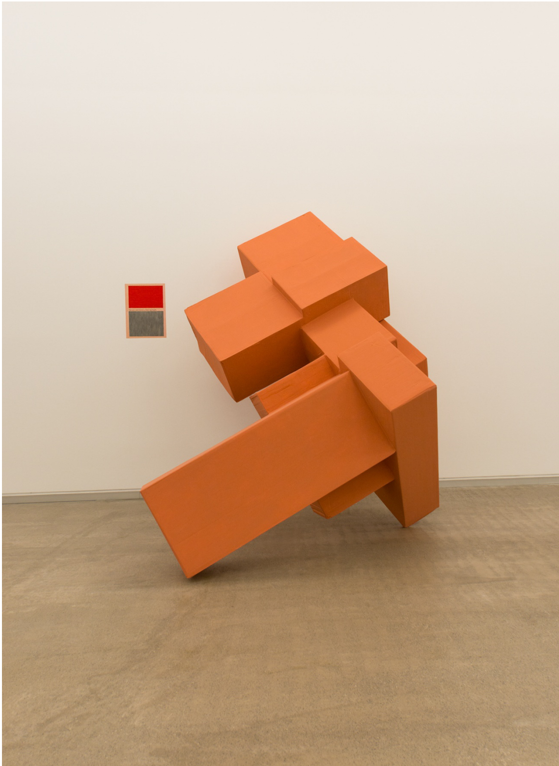
Masak II – menos mentiras. Cartón, pintura y papel impreso pintado