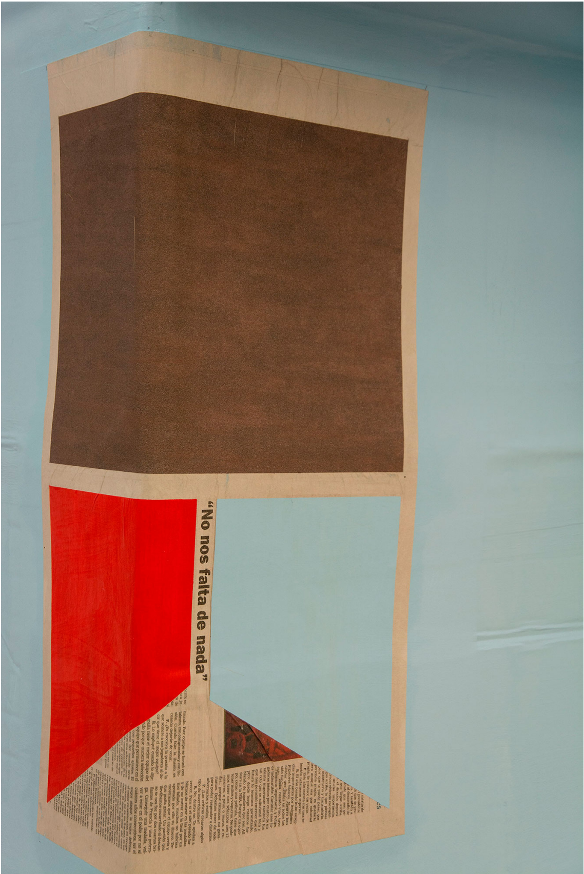
Detalle de la instalación