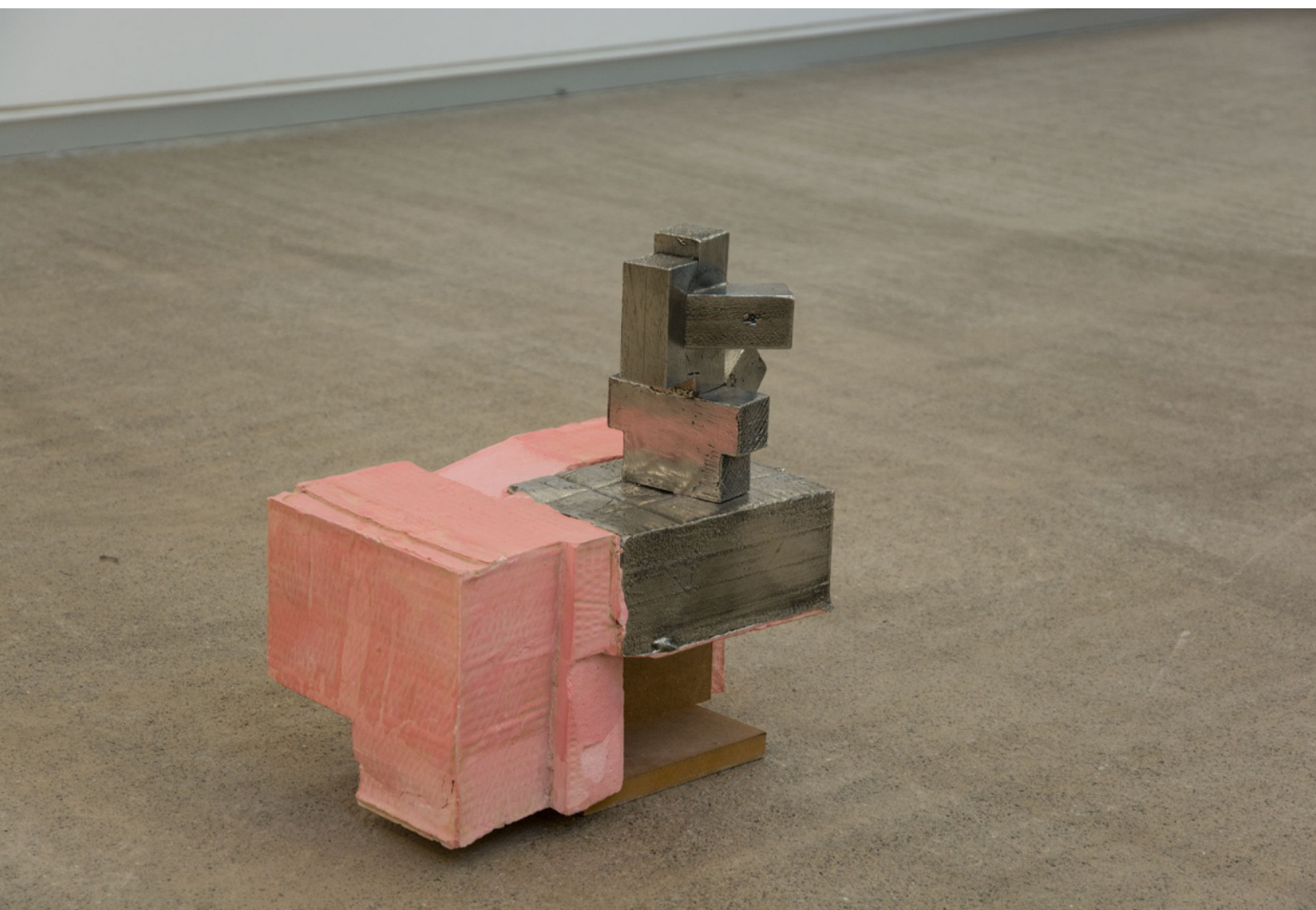
Multiple, diverso, unitario. Acero Inoxidable, escayola, madera. 42 x 23 x 35 cm