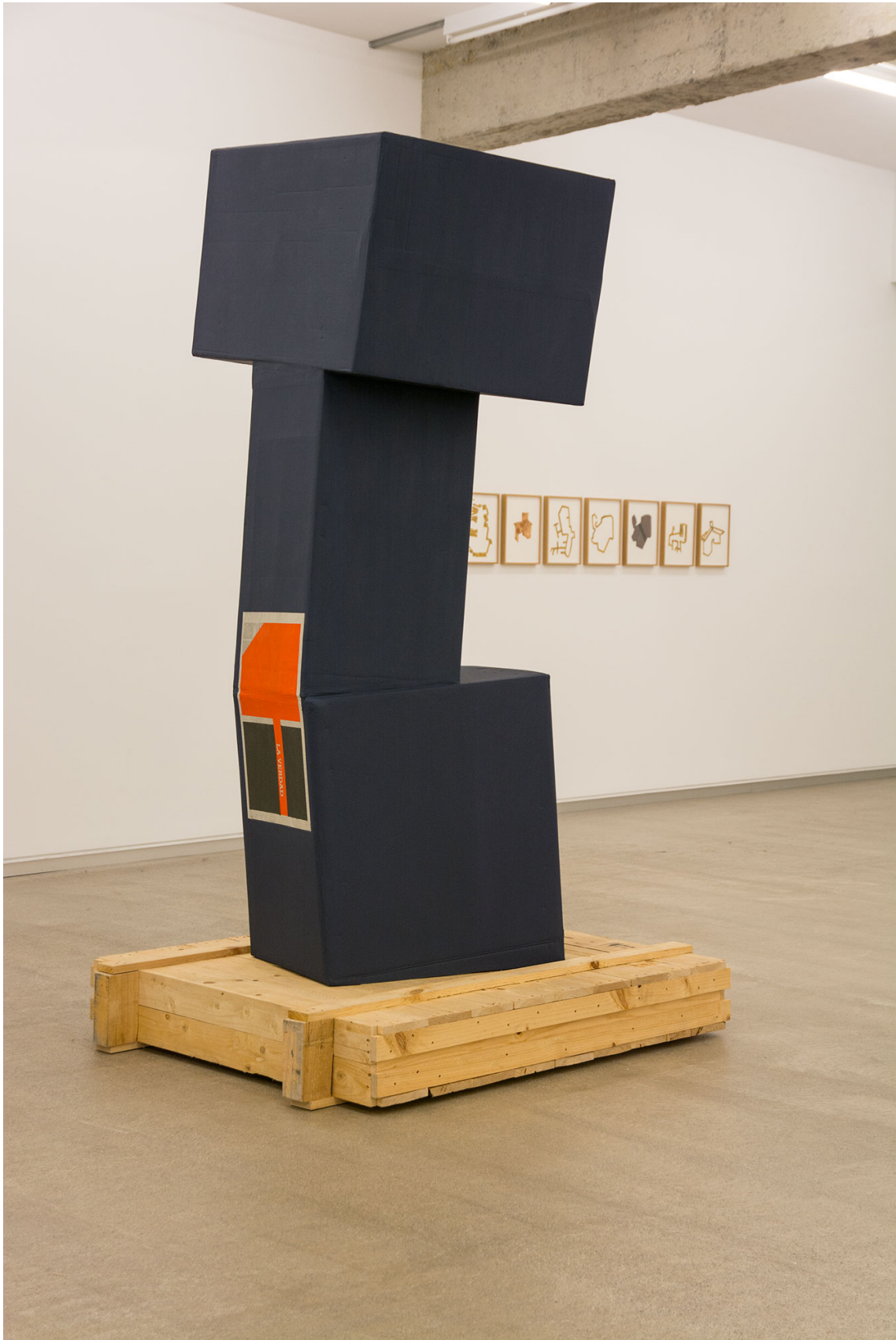
Masak III – la verdad. Cartón, pin tura, madera y papel impreso pintado. 250 x 135 x 117 cm