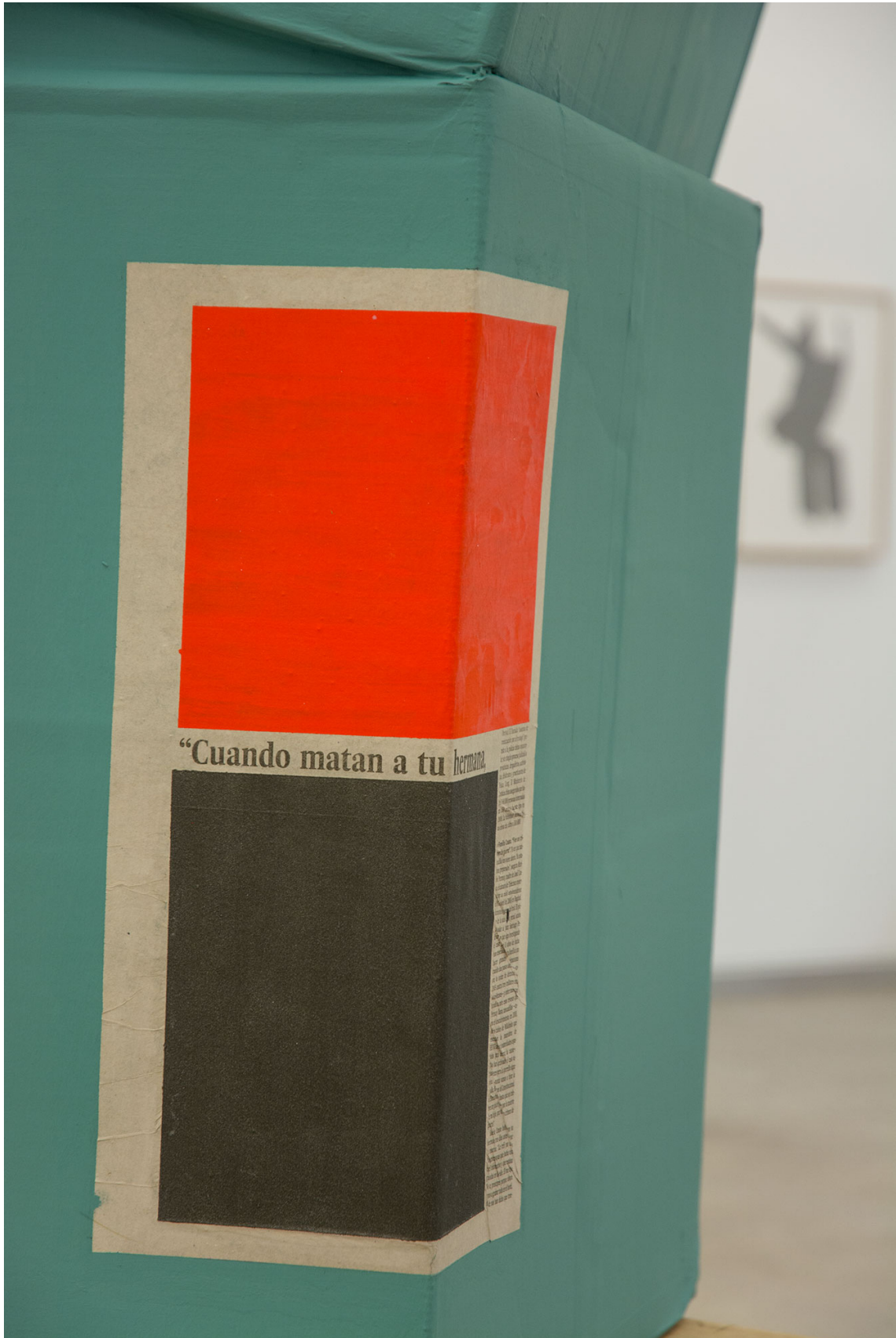
Masak IV – Cuando matan a tu hermana. Cartón, pintura y papel impreso pintado, 210 x 262 x 70 cm