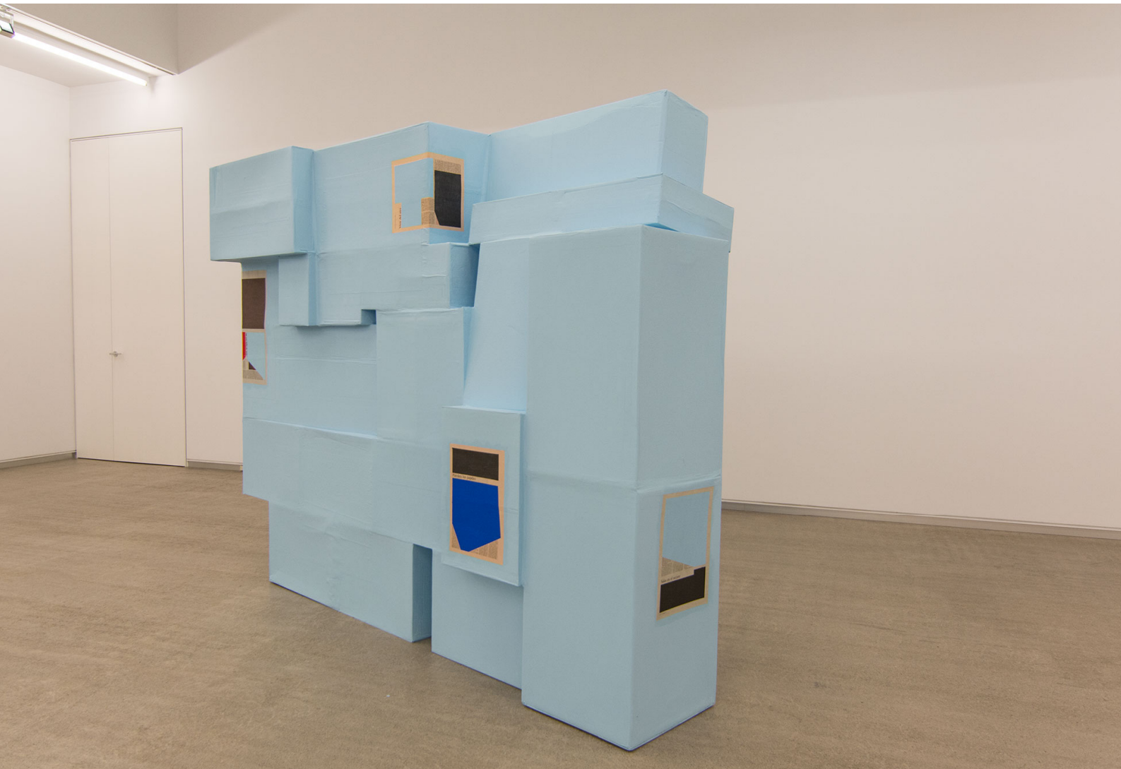
Masak I- no nos falta de nada. Cartón, pintura y papel impreso pintado. 210 x 262 x 70 cm