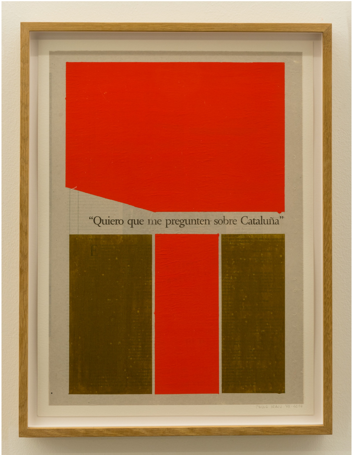
Catalunya . Pintura sobre papel impreso. 65 x 50 cm