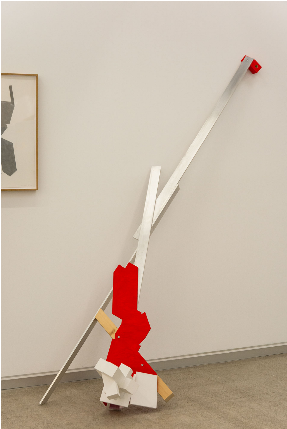
Itzalak - Neverland. Aluminio, madera y pintura. 202 x 171 x 92 cm