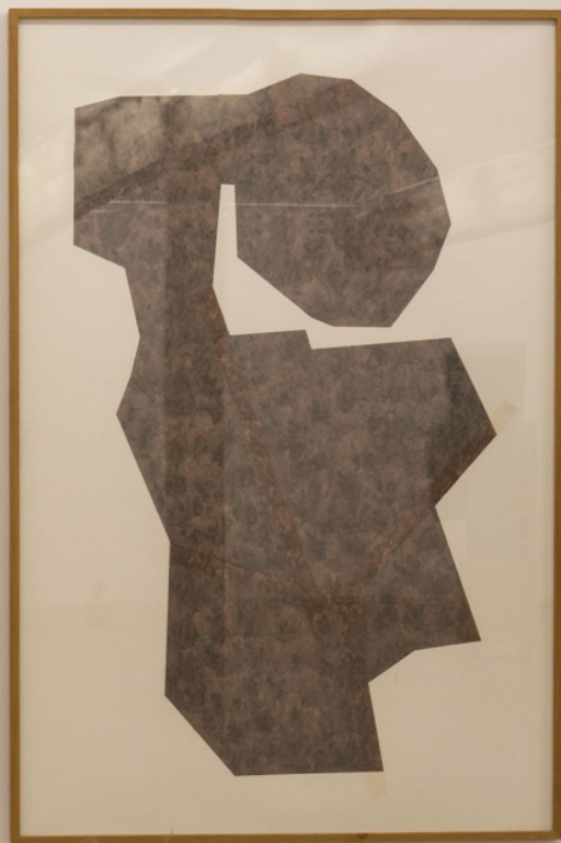
Siluetak I-II. After. Pintura metálica y cinta adhesiva. 230 x 152 cm